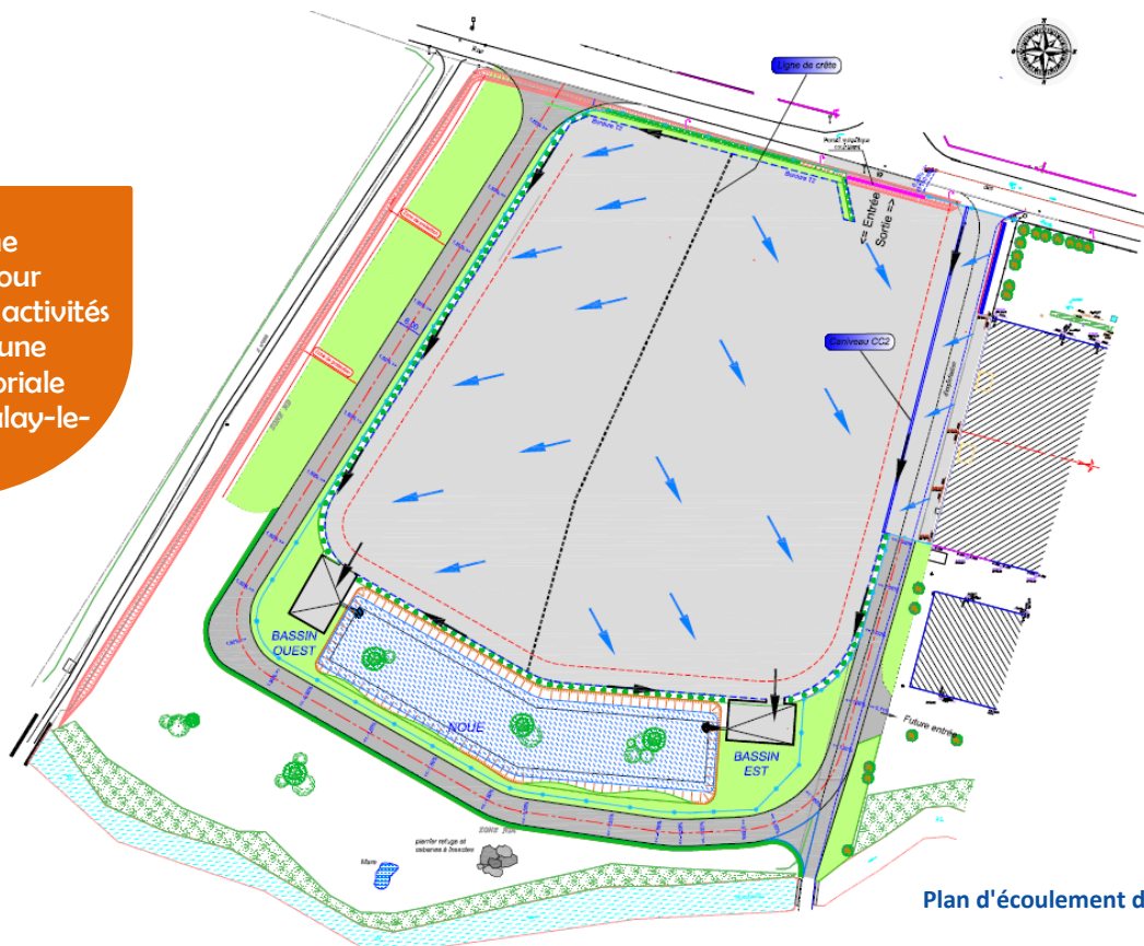
Plan d'écoulement des eaux

Création d'une plateforme pour regrouper les activités d'entretien d'une agence territoriale routière à Malay-le-Grand (89)